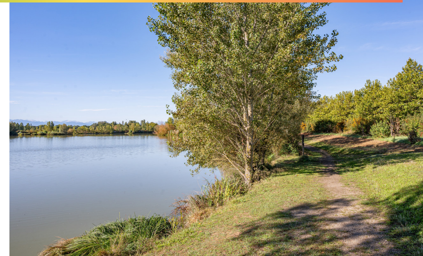
Le sentier de la boucle des étangs au Domaine des Oiseaux, un parcours accessible à tous pour observer la faune et la flore locales.

Au Domaine des Oiseaux, à Mazères, une boucle de 5 kilomètres invite petits et grands à s'immerger dans un cadre préservé, entre étangs scintillants, prairies tranquilles et boisements accueillants. La marche, douce et accessible, permet d'observer cigognes, canards et passereaux dans leur environnement naturel, tout en profitant de pauses le long du sentier pour contempler le paysage et écouter le bruissement de la faune. Plus loin, une ancienne grange transformée en espace pédagogique rappelle l'histoire agricole du site avant de mener à l'étang d'Augé, souvent animé par les migrations saisonnières. Le retour se fait par un chemin bordé de roselières et de haies sauvages, propice à la découverte de nouveaux oiseaux et riche en biodiversité locale. Récemment mise en valeur par l'intercommunalité, cette